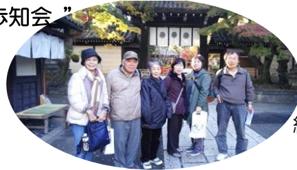
紅葉の京都散策と あぶり餅を求めて