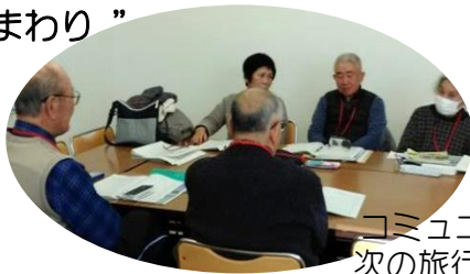
コミュニティ室で 次の旅行の相談