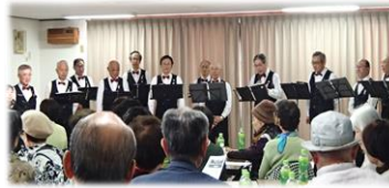
男性ボーカルアンサンブル The 40's (ザ フォーティーズ)