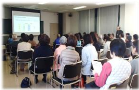
認知症の人への対応のし方を学び