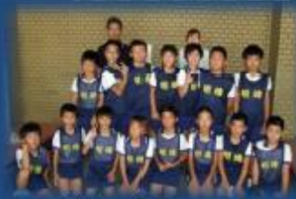
高学年明峰男子チーム