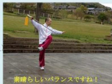
素晴らしいバランスですね！

場所：日生中央センタービル 緑台公民館 川西総合体育館 日生公民館 NSI清和台スポーツクラブ