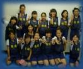
高学年明峰女子チーム