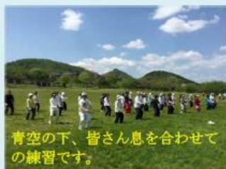
青空の下、皆さん息を合わせての練習です。