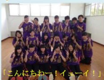
「こんにちはー！イェーイ！」