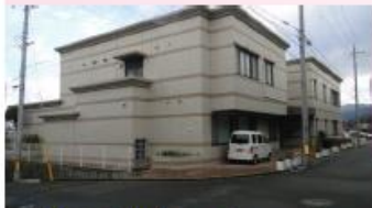
明峰公民館内にコミュニティ 事務室を設置