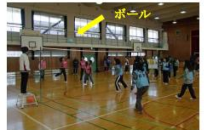
華麗なるトス廻し