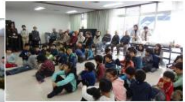
萩原台自治会の三世交代行事