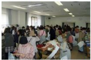
いつもながら賑わうバザー第1会場

昨年と異なった今回の取り組みとして、オークションがあり、賑わいました。また、川西市の大型ゴミ有料化方針を受け、ルピナスの会として大型提供品の受け入れを遠慮させて頂きましたので、商品構成も例年とは幾分異なりました。