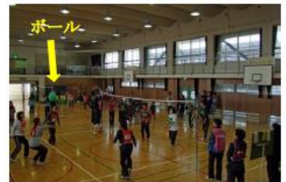
きれいなトスの形ですネ。