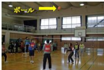
えらく高いところまで