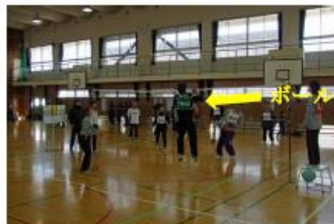
ボールはネットの向こう、相手コート側です